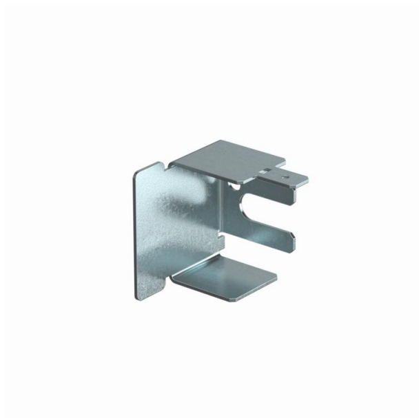
Završni komad levi za zatvaranje LKM-kanala.