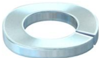
Feder podloška M6